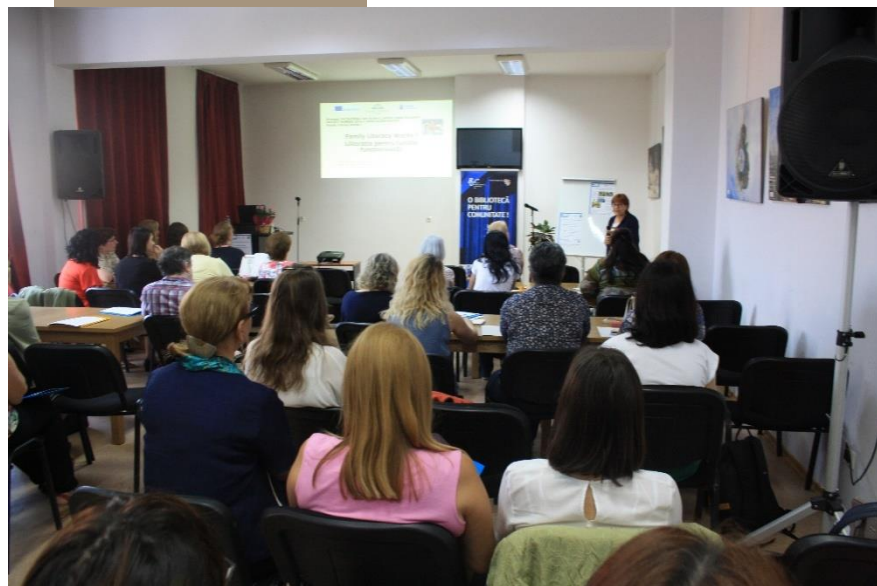
Првиот настан дисеминација, Клуј-Напока, Романија

Важноста на семејната писменост за спречување на прераното напуштање на школувањето - културно кафе дел I, активностите во работните групи / II дел, презентирање на заклучоците од работните групи